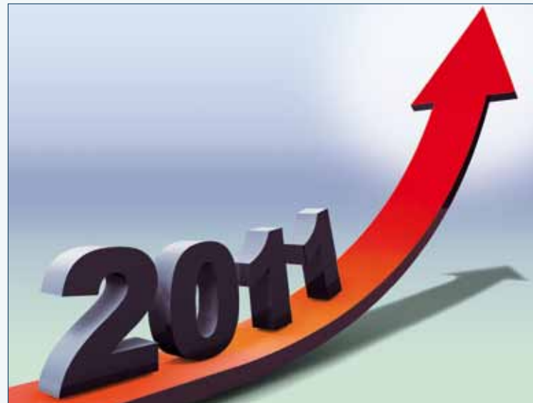
Fristensache: Ein Tag entscheidet